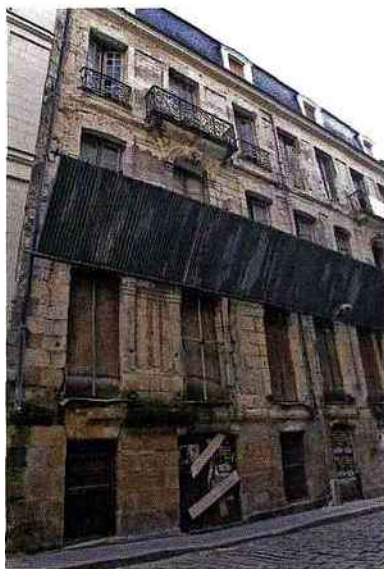
Cet immeuble du XVIII e siècle (au-dessus), situé île Feydeau, dans l'hypercentre de Nantes, a été rénové (à droite) et commercialisé en 2005, découpé en douze lots d'un coût de 3600 €/m 2 . Un prix qui intègre celui du foncier et 1500 €/m 2 et celui des travaux: 2100 €/m 2 .

Encadrer les travaux dans le cadre d'un tel investissement clés en main, c'est même l'objectif du contrat de vente d'immeuble à rénover, dit VIR mis en place par la loi ENL du 13 juillet 2006 et applicable depuis un décret du 16 décembre 2008. Il est le pendant juridique, pour l'ancien,